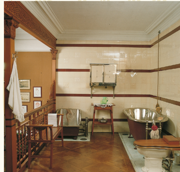
Badezimmer / Salle de bains / Bathroom