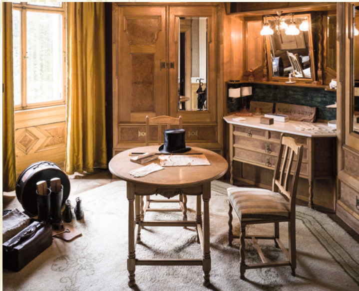
Herrenankleidezimmer / Vestiaire pour hommes / Men's dressing room