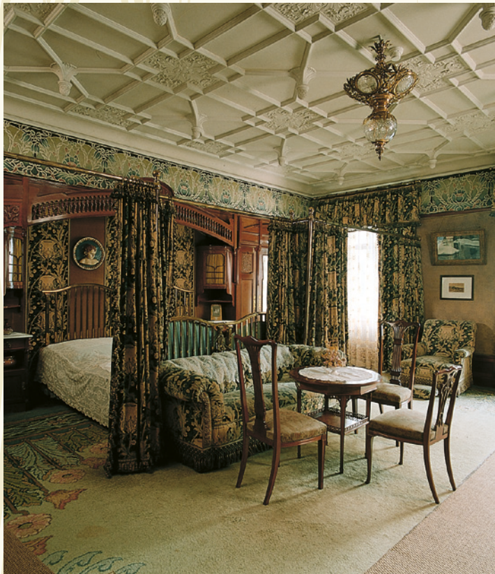
Schlafzimmer / Chambre à coucher / Bedroom

The Baron was married to Adelheid Sophie Margaritha von Bonstetten (1814–1883). He died in 1869. The Castle of Hünegg is not an ordinary museum with collections. The interior has remained unchanged since 1900. It seems as if time has stood still and that the owners have just left an will return at any moment. The noble residence is situated in a beautiful wooded park.