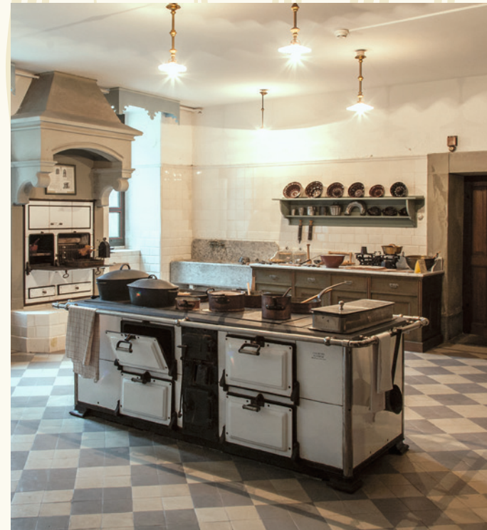
Küche / Cuisine / Kitchen