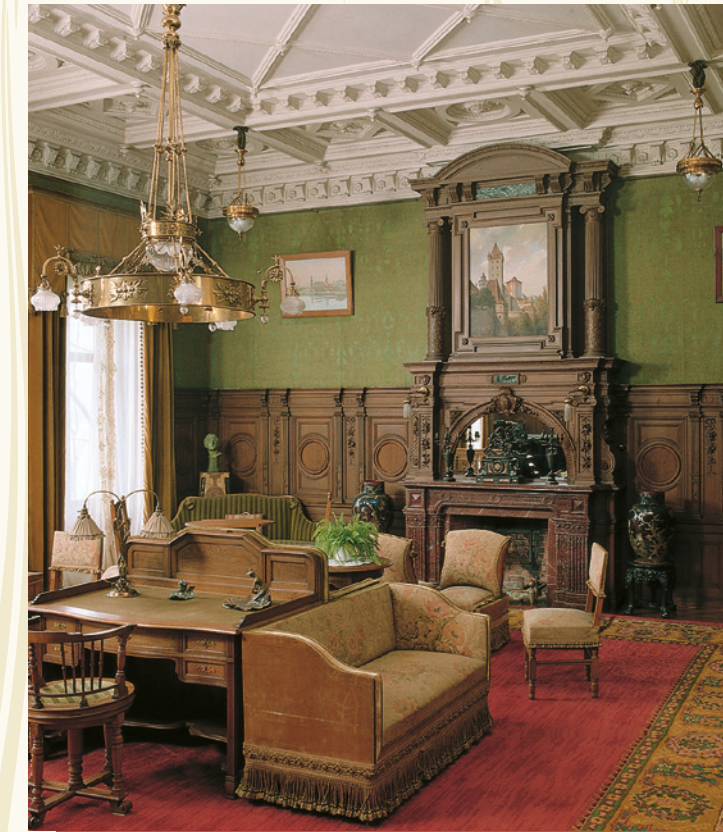
Grosser Salon / Grand salon / Lounge