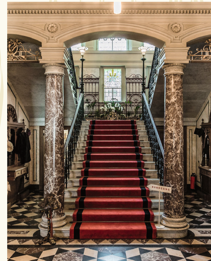
Eingangshalle / Entrée / Entrance hall

Le Château d'Hünegg n'est pas un Musée ordinaire avec des collections. C'est au contraire une des rares maisons de maître en Suisse, où les intérieurs, depuis la dernière rénovation de 1900, sont restés inchangés jusqu'à nos jours. On visite le château avec l'impression que les propriétaires de cette époque sont seulement absents pour quelques instants. La noble résidence est située dans un parc merveilleux, riche de vieux arbres.